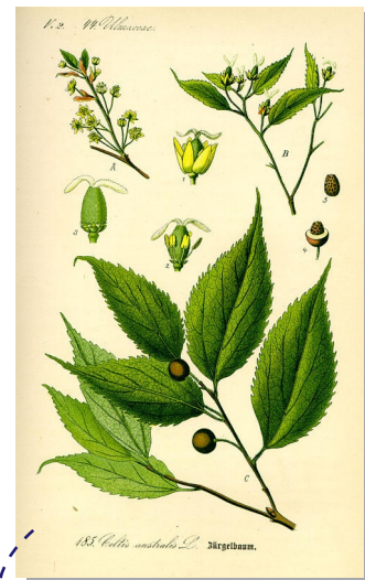
Particolare della foglia e della drupa (frutto)

Originario di tutta l'area mediterranea, dalla Spagna al Caucaso e all'Asia occidentale, sino all'Africa settentrionale, questo albero assai elegante è resistente e assai longevo, può vivere infatti diverse centinaia di anni. Il nome comune di bagolaro deriva forse dal richiamo onomatopeico al chiacchiericcio della moltitudine di uccelli che ne prediligono la vasta chioma per radunarsi nelle sere di fine estate (nei dialetti del nord-est italiano "bagolar" significa sia "tremolare" sia "ciarlare"). L'apparato radicale assai sviluppato e particolarmente robusto dà al bagolaro il curioso soprannome popolare di "spaccasassi". Penetrando e sprofondando nelle più piccole fessure di terreni anche aridi e rocciosi, essendo in grado di sopravvivere anche in condizioni estremamente ingrato. Inoltre, il legname flessibile e robusto, resistente alle condizioni climatiche avverse, possiede la sostanziale inattaccabilità da parassiti ed agenti patogeni. Produce un frutto, drupa subsferica di circa 8-12 mm, di colore blu scuro, molto dolce del tutto simile ad una perla.